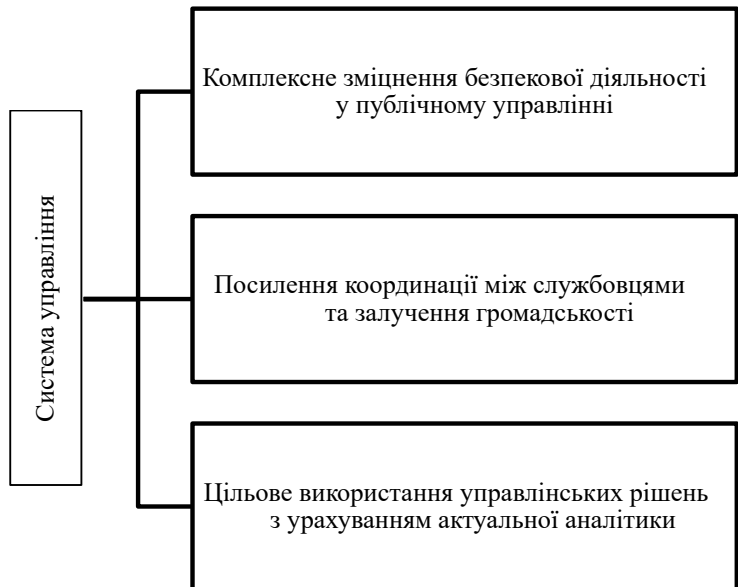
Рис. 3. Траєкторія реагування на сучасні загрози безпековій діяльності публічної служби

Висновки. Підсумовуючи, зазначимо, що інформаційна складова є однією з найактуальніших у контексті сучасних загроз. Швидкість поширення даних та їх маніпулятивні інтерпретації становлять серйозну небезпеку для публічної служби, провокуючи інформаційні атаки та знижуючи рівень довіри з боку суспільства. Тому службовці мають постійно