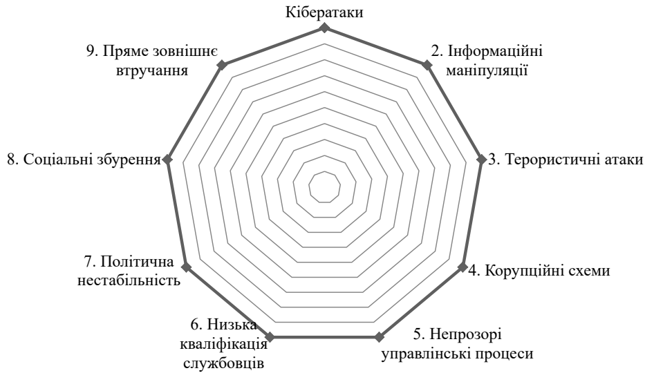
Рис. 2. Загрози безпековій діяльності публічної служби