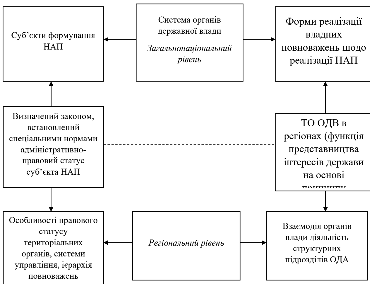
Рис. 3. Схема організації адміністративного аспекту розроблення та впровадження антикорупційної політики [5]

вдосконаленні політичних, економічних, соціальних і правових механізмів протидії організованій злочинності та корупції. Оскільки такий досвід є різноманітним, його ефективність насамперед визначається комплексом взаємопов'язаних чинників, зокрема соціально-економічними умовами, рівнем розвитку політичної культури та якістю державного управління.