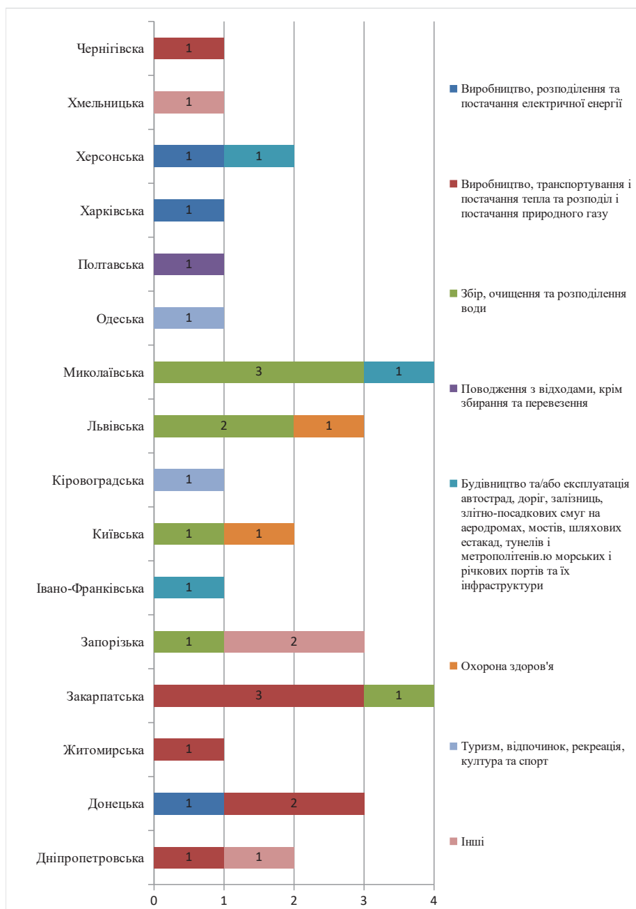
Рис. 2. Структура проєктів договорів публічно-приватного партнерства Міністерства економіки України