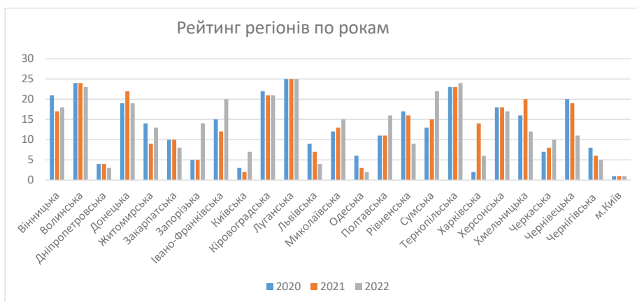
Рис. 2. Результати рейтингування регіонів за рівнем модернізації соціальних послуг у 2020-2022 роках

*розраховано автором за даними Державного комітету статистики