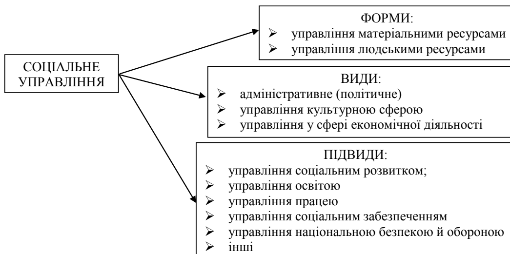
Рис. 3. Форми, види і підвиди соціального управління