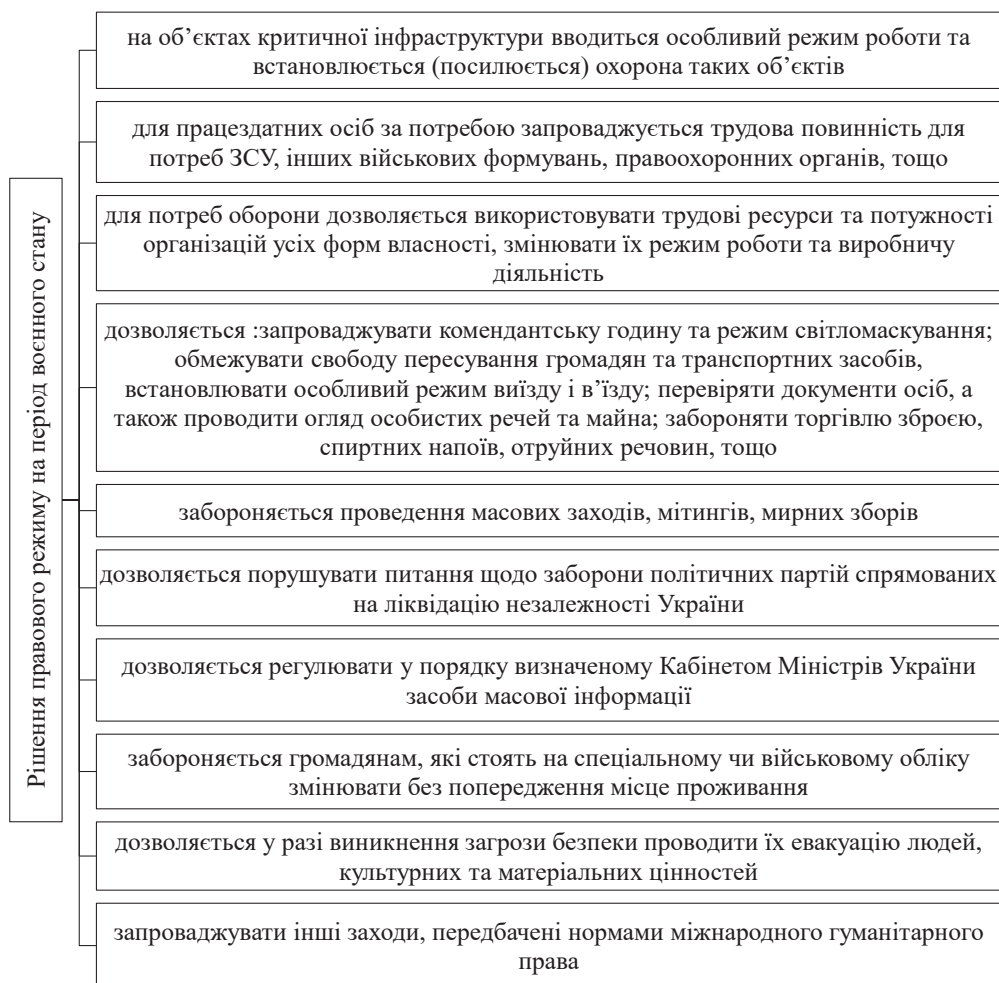
Рис. 1. Приклади рішень правового режиму під час військового стану[6]