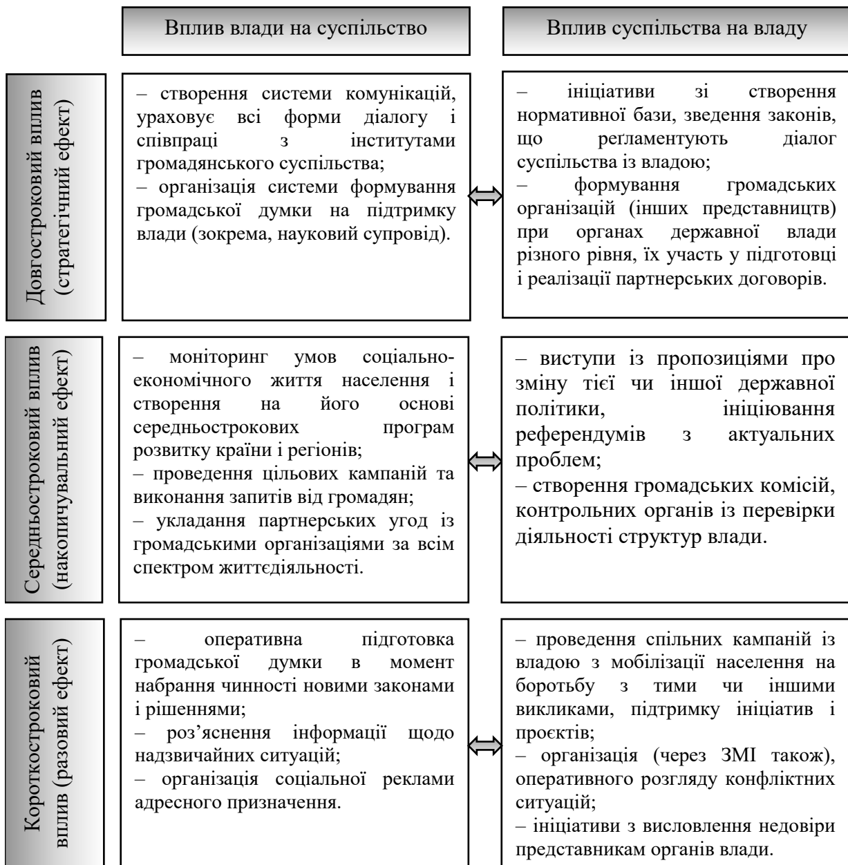
Рис. 1. Концептуальна модель комунікативної взаємодії на рівні «державна влада – громадянське суспільство»

Створення необхідних оргструктур, залучення цільових коштів, забезпечення ефективного контролю за результатом зусиль – усе це актуалізується в рамках короткострокового впливу.