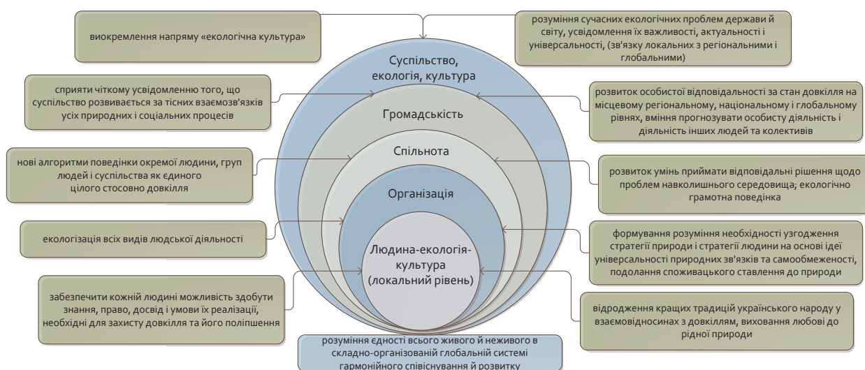
Рис. 2. Взаємозв'язок складових розвитку системи екологічної культури