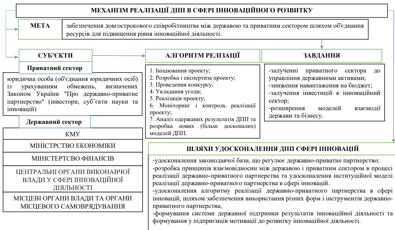
Рис. 3. Механізм реалізації ДПП в сфері інноваційного розвитку