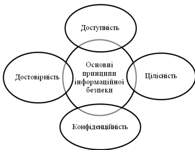
Рис. 1. Основні принципи інформаційної безпеки

Вважаємо також за доцільне визначити та проаналізувати об'єктивні та суб'єктивні