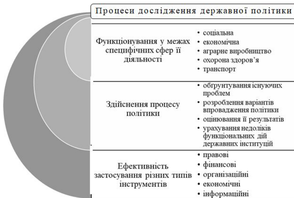
Рис. 2. Складники процесів дослідження державної політики

Передусім варто визначитися з основними процесами дослідження виваженої державної політики, котрі відіграють важливу роль у формуванні управлінських рішень під час її здійсненні в стратегічно важливій галузі тваринництва (рис. 2).