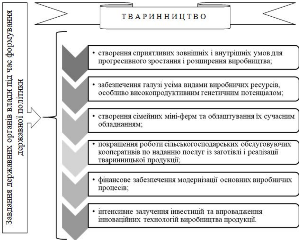
Рис. 3. Завдання державних органів влади під час формування та здійснення державної політики у тваринництві

Варто зазначити, що державна політика відбиває цілеспрямовану діяльність органів державної влади, котра спрямовується на її формування та здійснення державними інститутами та забезпечує збалансування інтересів різних колективів, соціальних і політичних груп, політичних партій та громадських організацій у державі. Однак, на сьогодні «<...> інститути держави видаються слабкими (насамперед через недотримання законів та