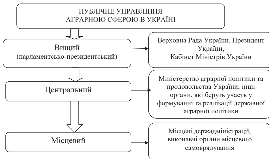
Рис. 1. Інституційний публічного управління у сфері аграрного розвитку України*

Президент України: здійснює внутрішню та зовнішню політику держави, є главою держави і представником України на міжнародному рівні; виступає ініціатором аграрних реформ та розвитку аграрного сектору; президент може подавати законопроекти до Верховної Ради та активно впливати на законодавчий процес у сфері аграрного господарства; підписує закони та акти, прийняті Верховною Радою, включаючи закони, що стосуються аграрної політики, а підписані президентом закони набувають чинності; має можливість