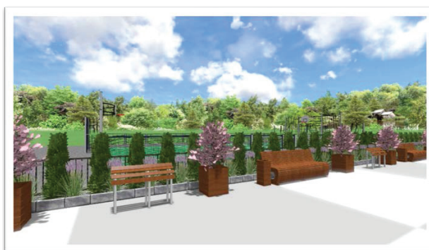
Рис. 3. Вигляд проекту для Черкаської гімназії №31