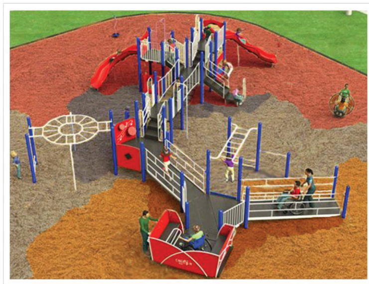
Рис. 1. Вигляд проекту «Створення дитячих майданчиків для дітей з обмеженими можливостями»

тури та садового дизайну, де нами було створено проект «Крок за Кроком» (рис. 2) . Даний проект був нагороджений лауреата 2 ступеня. Мета проекту – створення безбар'єрного доступного, безпечного, середовища. Цінність дитячого майданчика полягатиме у тому, що всі діти можуть гратися разом, без будь-яких перешкод.