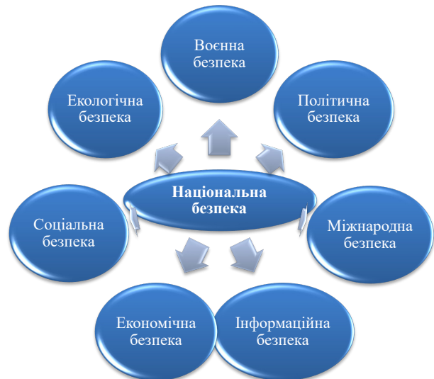
Рис. 2. Складові національної безпеки України

Одним з пріоритетних напрямків у сфері національної безпеки є екологічний аспект.