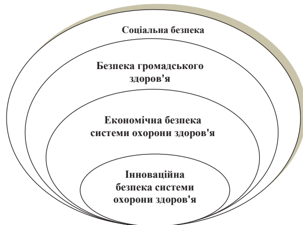
Рис.2. Основні складові державної системи охорони здоров'я

важень на міждержавний або наддержавний рівень міжнародної економічної діяльності. Державами створюються міжнародні організації для вирішення проблем співробітництва, безпеки і розвитку у світовому масштабі [2].