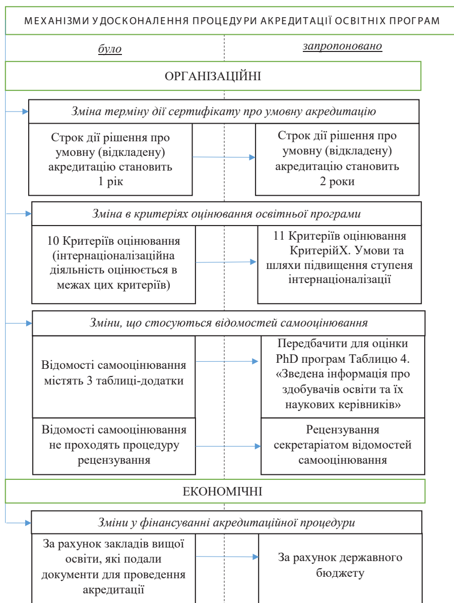
Рис. 1. Механізми удосконалення процедури проведення акредитації