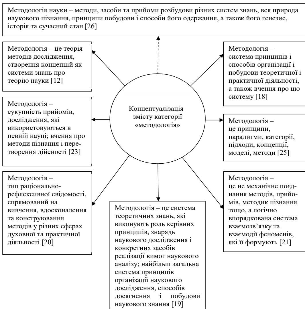
Рис. 1. Концептуалізація змісту категорії «методологія»

Приймаючи до уваги зміст рисунка 1, можемо визначити такі основні характеристики змісту категорії «методологія»: