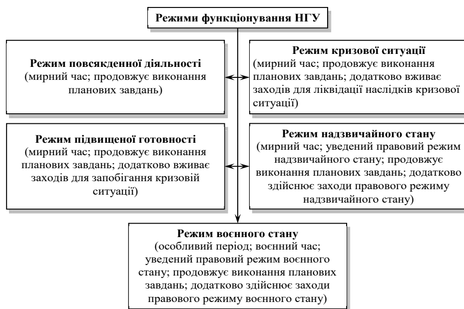
Рис 2. Режими функціонування НГУ та їхня характеристика

За своїм змістом перелічені завдання можна віднести до превентивного управління