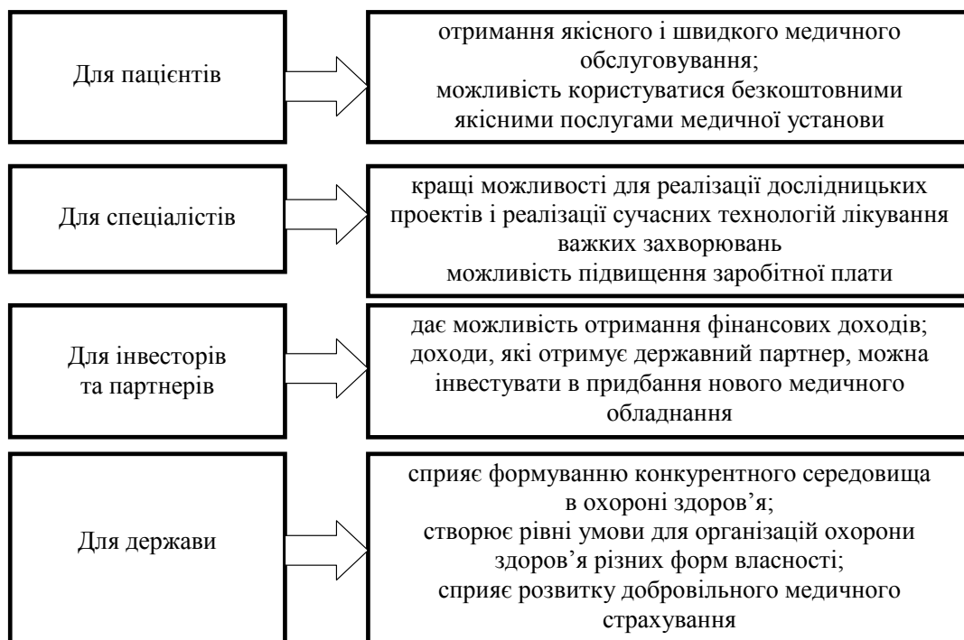
Рис. 2. Переваги від державно-приватного партнерства у сфері охорони здоров'я*

Розвиток державно-приватного партнерства у сфері охорони здоров'я повинен спиратися на певні принципи, див. рис. 1.